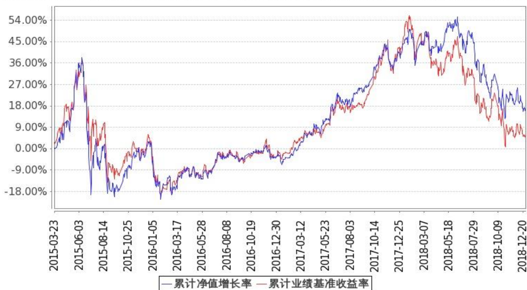
图：嘉实新消费股票基金份额累计净值增长率与同期业绩比较基准收益率的历史走势对比图 (2015年3月23日至2018年12月31日)

注：按基金合同和招募说明书的约定，本基金自基金合同生效日起6个月内为建仓期，建仓期结束时本基金的各项投资比例符合基金合同（十二（二）投资范围和（四）投资限制）的有关约定。